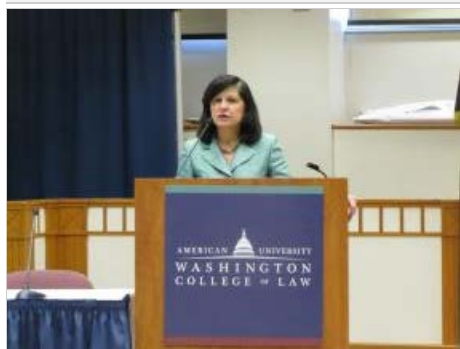
Carmen Ortiz, fiscal federal para el distrito de Massachusetts.